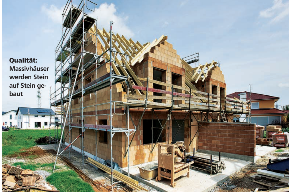
Qualität: Massivhäuser werden Stein auf Stein gebaut

arbeitet mit Franchiseunternehmen alphabetische Sortierung